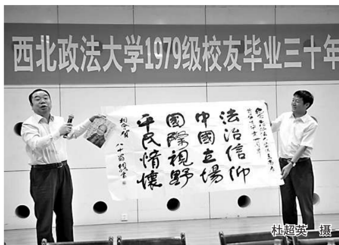
西北政法大学1979级校友毕业三十年

想法和具体措施。甘肃政法学院焦盛荣副院长也介绍了本校近年来国际教育的发展历程和经验。 随后,六所高校的国际交流与合作处处长和部分国际教育学院院长对各校国际化和合作的具体情况进行了详细解构。本次论坛为各高校提供了良好的交流与合作平台,也对全国政法大学“立格联盟”今后的发展战略进行了构架与畅想。 (国际交流与合作处)